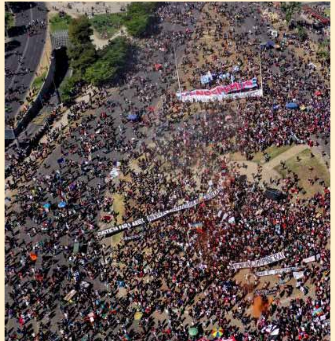
Manifestação em Santiago do Chile

Nos últimos dias, uma multidão tomou as ruas na Bolívia e no Chile em comemoração a dois resultados nas urnas. Na Bolívia, Luis Arce, do partido do ex-presidente Evo Morales, venceu as eleições no primeiro turno, quase um ano após a renúncia forçada de Evo.