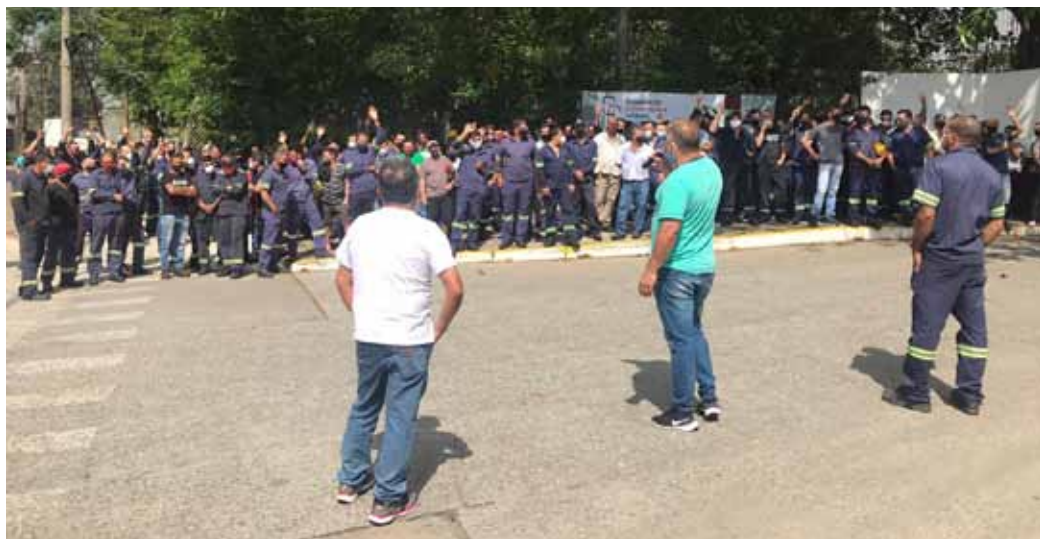
Trabalhadores da Paranapanema em assembleia

O Sindicato dos Metalúrgicos de Santo André e Mauá reuniu os trabalhadores da Paranapanema em assembleia nesta terça-feira, dia 27, para colocar em votação a proposta de compensação para o fim do ano e dar informes sobre a Campanha Salarial 2020. Os trabalhadores rejeitaram a proposta de compensação que prevê folga no Natal a partir de 24 de dezembro com retorno no dia 28 e no Ano Novo a partir do dia 31 de dezembro com retorno em 4 de janeiro de 2021, com compensação nos sábados dias 5 e 19 de dezembro. Os traba-