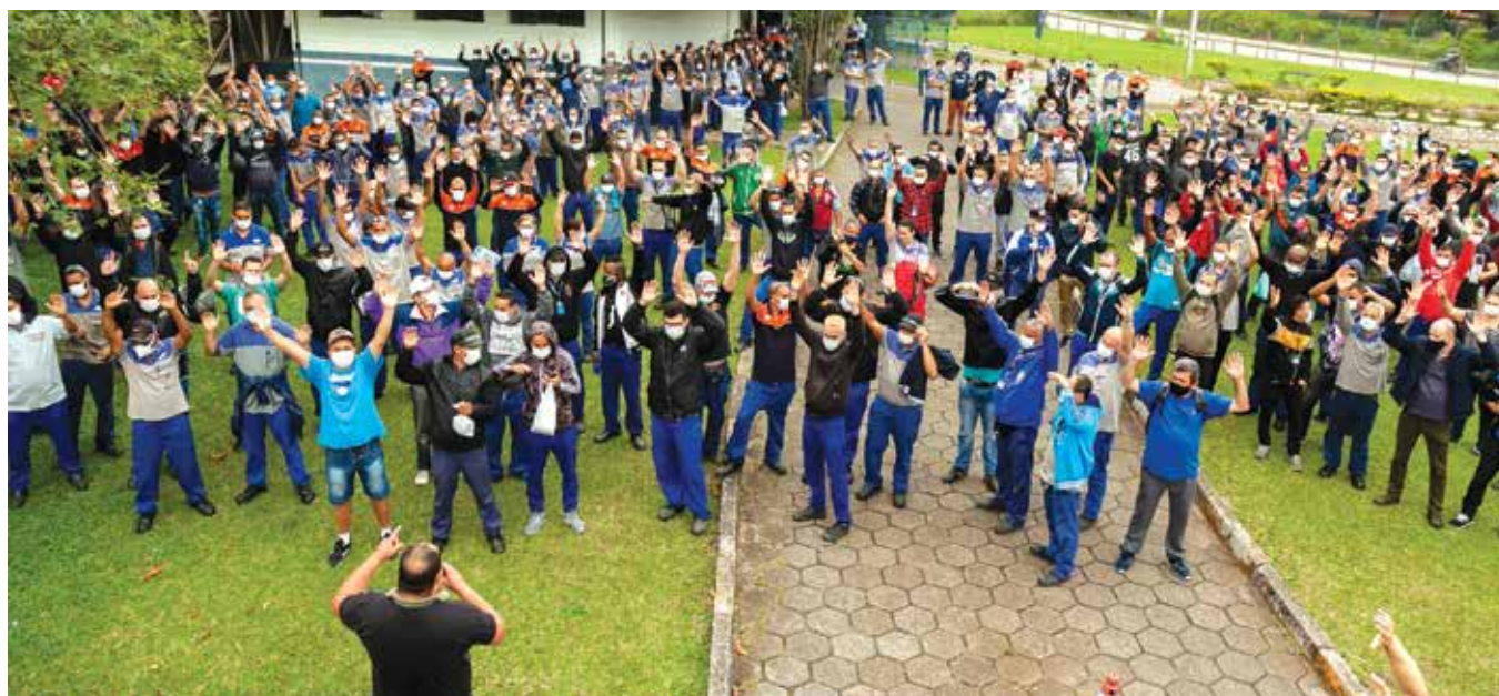
Cesta Básica. Com a inflação em alta, pressionada pelos alimentos, entre outros itens, os trabalhadores da Marelli estão reivindicando cesta básica

As negociações prosseguem e, até o momento, é o único acordo fechado com grupos patronais. Conforme decisão dos trabalhadores na assembleia que aprovou a proposta do Sindipeças, as bases desse acordo são parâmetros para as negociações com outros grupos patronais e também em negociações diretas do Sindicato dos